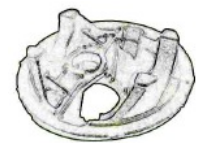
デフキャリア 120秒/個