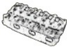
シリンダーヘッド 60秒/個