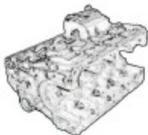
シリンダーブロック 240秒/個